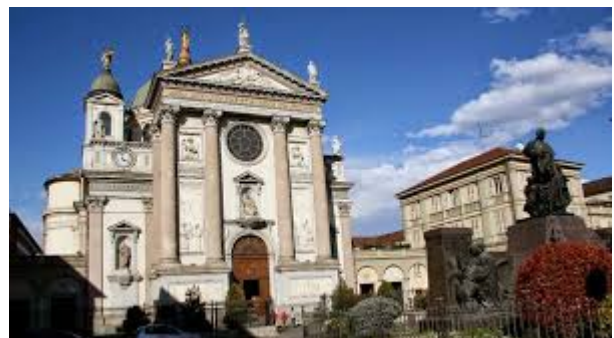
Basilica de María Auxiliadora – Turín y delante a la derecha monumento a Don Bosco sufragado por los antiguos Alumnos.

El 9 de Junio de 2018 celebramos los 150 años de la consagración del templo de María Auxiliadora.